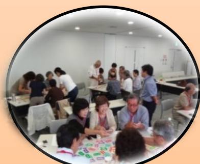
支え合いの組織づくり